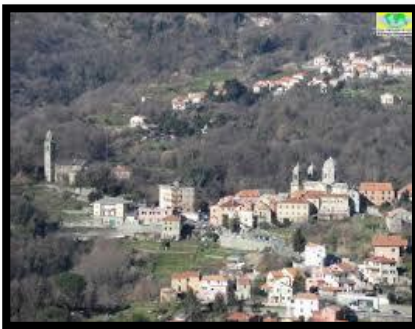
Panorama di Stella San Giovanni