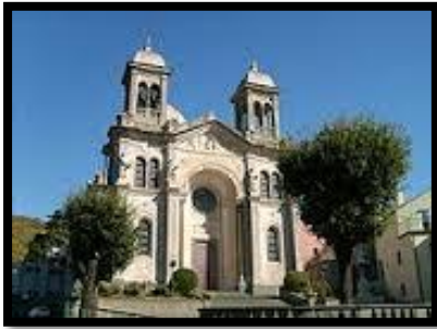
Chiesa di San Giovanni

Il patrono è il santo protettore che si festeggia il 24 Giugno.