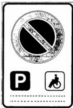
Figura Il 79/a Art. 120

La zona di sosta è individuata attraverso apposita segnaletica orizzontale e verticale, indicante gli estremi del "contrassegno di parcheggio per disabili" del